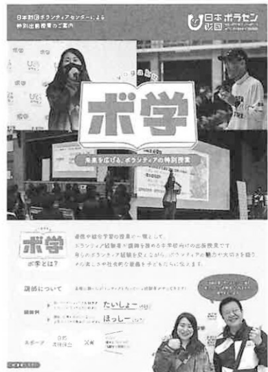
ボランティア経験者が講師を務める中学校向け出前授業「ボ学」のリーフレット（ホームページ内からダウンロードできます）

「朝日新聞SDGs ACTION!」ホームページ内記事（最終更新：2024.07.30）。ボランティアの4原則のほか、ボランティアのメリットや参加するとき気をつけたいこと、参加の方法などわかりやすく解説しています。